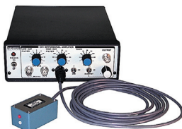
EX1 細胞外記録用AC/DCアンプ、差動ヘッドステージ